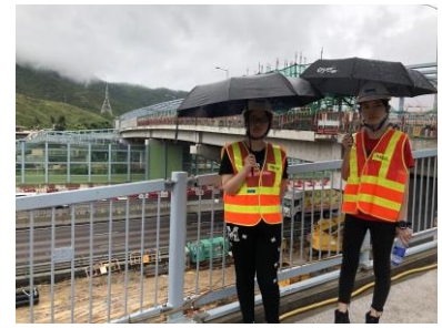
學生穿上工衣體驗路政署工作

這次體驗活動令我對道路規劃有了更深刻的了解，以前從未注意路邊的交通工程，現在才知道原來一次改道工程的背後是數十個工程師不辭辛勞的籌劃。工地的臨時板房原來也是別有洞天，這次有幸在幾位工程師帶領下進入板房，不得不感嘆路政署人員工作量之重。希望下次還有這些機會參加工作體驗。