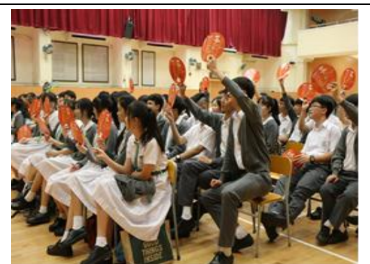
學生踴躍地表達意見

2018 年 10 月本組舉辦「吸煙多面睇」工作坊，透過實況故事短片、動畫、互動遊戲及角色扮演等，與學生探討吸煙的影響，並學習有效的拒絕技巧，加強學生拒絕吸煙的信心，建立自我控制能力，學習尊重自己、尊重他人。