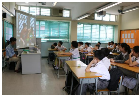
學生專注地欣賞反吸煙短片

本組於2018年10月邀請新界北區文藝協進會到校為學生舉辦舞台劇《鑄情》北區學校巡迴演出，是次活動由香港戲劇工程負責，揉合莎士比亞的《羅密歐與茱麗葉》與湯顯祖的《牡丹亭》兩大東西方名著，以文化表演的形式，讓學生反省時下青年的愛情觀，希望學生能以多角度思考，處理自己的情感，為自己為他人負責任。學生當日表現投入，反應十分理想。