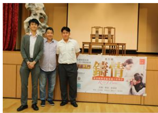
學生與《鑄情》監製留影