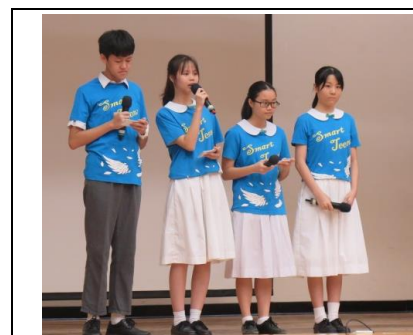
學生擔任司儀工作游刃有餘

第10屆Smart Teens領袖訓練計劃已順利完結，嘉許禮已於2018年9月5日舉行。Smart Teens成員於暑假期間回校籌備嘉許禮，各成員各有崗位，無論司儀組、台上分享組、舞台音響組、舞台燈光組、攝影組及獎項頒發組都表現得非常投入，盡力做到最好，表現值得讚賞。