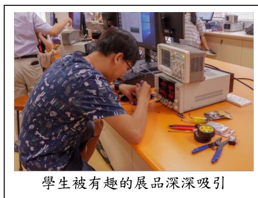
學生被有趣的展品深深吸引