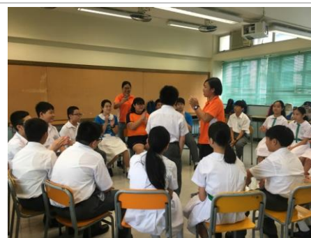
中一學生在愉快的氣氛下投入中學生生活

本組於2018年8月24日為中一新生舉辦迎新活動，活動分班進行，透過團隊合作的活動讓中一新生認識自己及新同學。15名Smart Teens領袖訓練計劃的學長協助活動進行、陪伴學弟學妹認識新校園、新同學；中一班主任亦趁此機會與學生互相認識，師生之間交流互動，加快中一新生投入中學校園生活。